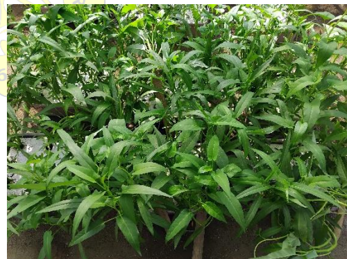
Tanaman kangkung 21 HST