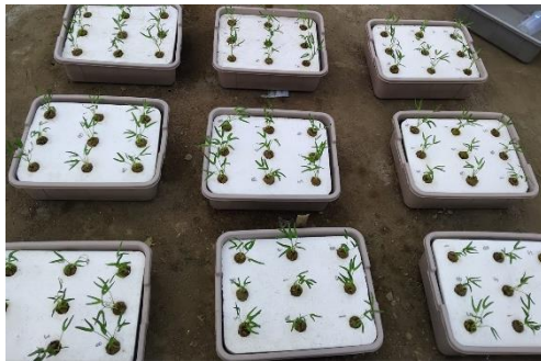
Tanaman kangkung 0 HST