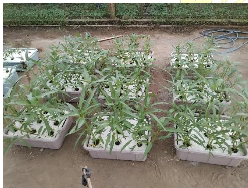
Tanaman kangkung 14 HST