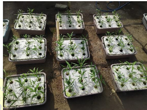
Tanaman kangkung 7 HST