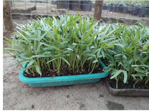
Bibit kangkung 6 hari setelah semai