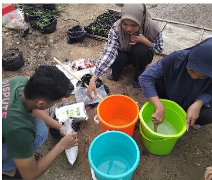
Pembuatan larutan ABmix, KOH, dan H_3PO_4