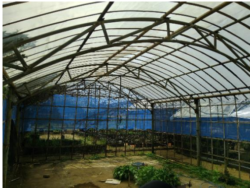
Persiapan Greenhouse A5