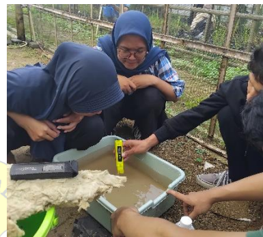
Kalibrasi dan pengecekan alat ukur