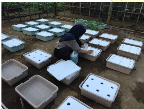
Pengaturan nutrisi sesuai perlakuan