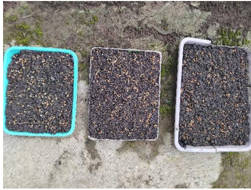
Penyemaian benih kangkung