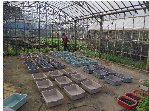
Penataan bak tanam