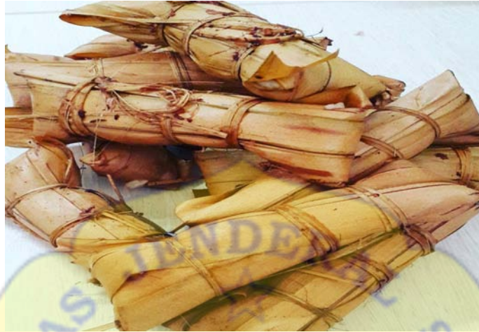
Gambar 2. Lepet