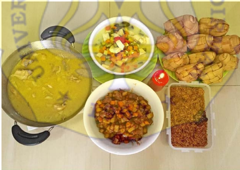
Gambar 3. Ketupat Sayur