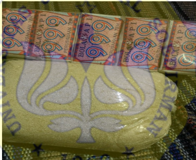
Gambar 7. Gula teh