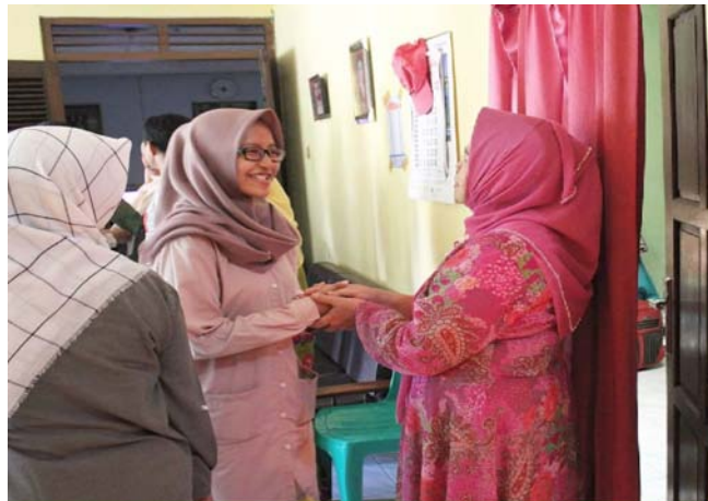
Gambar 6. Proses meminta maaf dan memaafkan