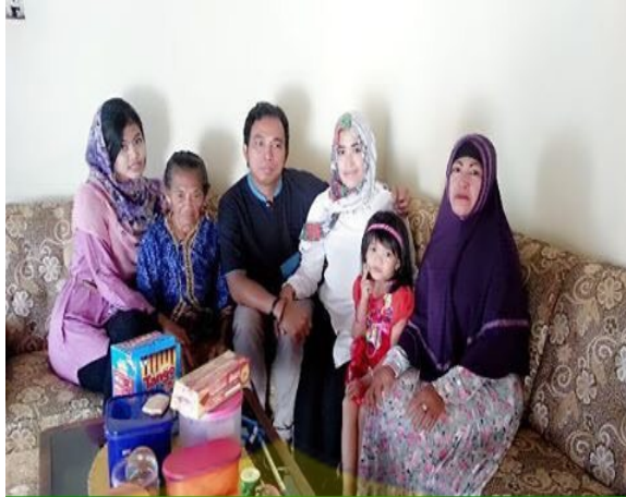
Gambar 4. Keluarga muda yang berkunjung