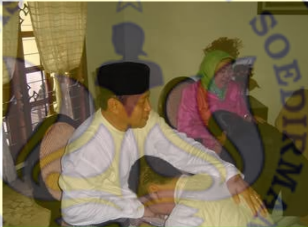
Gambar 5. Proses Sungkeman